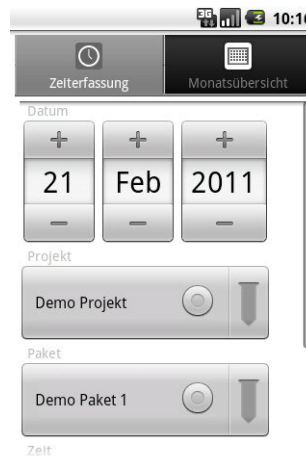
Mobile Zeiterfassung auf Android™ Basis