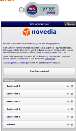
Mobilfreundliches Infosystem als Webapplikation